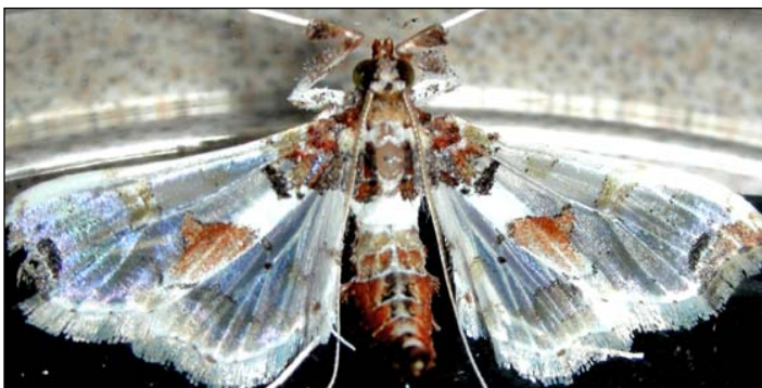
Figura 1. Adulto de Neoleucinodes elegantalis (Guenée).

Los adultos de esta palomilla miden alrededor de 2 cm ( \frac{3}{4} de pulgada) de envergadura de las alas y son de color blanco, presentando manchas café oscuro en la base y la punta del primer par de alas y una mancha, mas o menos triangular, café claro en el centro. Los bordes apical y posterior de ambas alas presentan un aspecto festoneado (Figura 1). En tomate, los huevos son depositados en el cáliz o directamente sobre las frutas, prefiriendo frutas de 2