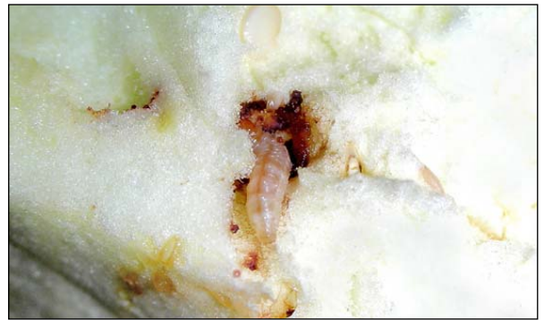
Figura 4. Larva de Neoleucinodes elegantalis : daño de barrenación causado en fruta de berenjena.