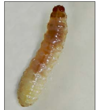
Figura 2. Larva de Neoleucinodes elegantalis .

Las larvas recién eclosionadas penetran en frutas de menos de 20 mm ( \frac{3}{4} de pulgada) de diámetro (Blackmer et al. 2001), dejando una cicatriz casi imperceptible que se aprecia como un área hundida con un punto necrótico (color café) de aproximadamente 0.5 mm (Figura 3). La larva se alimenta en el interior de la fruta (Figura 4) y al completar su desarrollo barrena para salir y empupar en el suelo. Debido a su hábito de salir del fruto para empupar, su presencia ha sido fácilmente detectada en los contenedores al momento de ser inspeccionados por agentes de cuarentena de los Estados Unidos. Los datos recabados en las empacadoras de vegetales orientales de Comayagua, indican que actualmente los niveles de infestación son de menos de 1%.